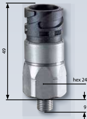
卡口 ISO 15170 (DIN 72585)